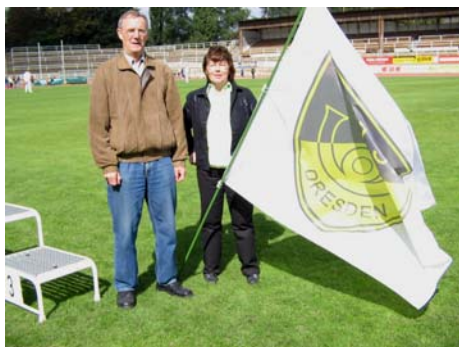
Vereinsvorsitzender und Geschäftsführerin