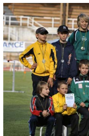
4x50m Sch C