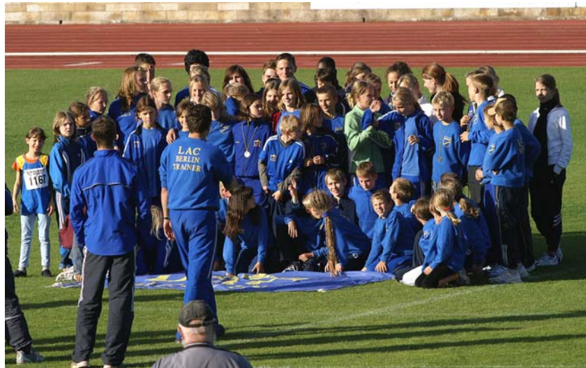
Delegation des LAC Berlin